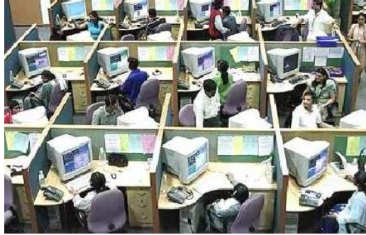
একটি কলসেন্টারের চিত্র

http://www.business.com/directory/telecommunications/call_centers/software/